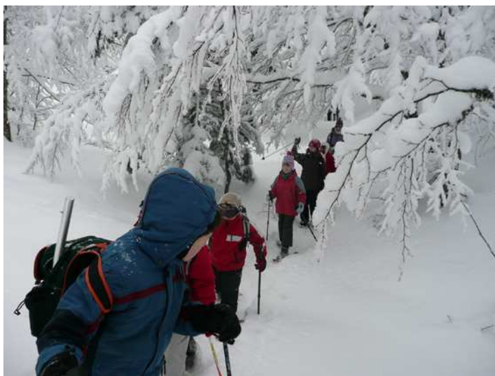
Ecole d'Aventure 2010