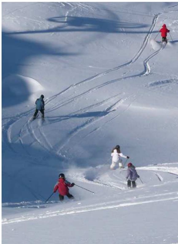
Ecole d'Aventure 2010 : entre cascade de glace et ski tout terrain.